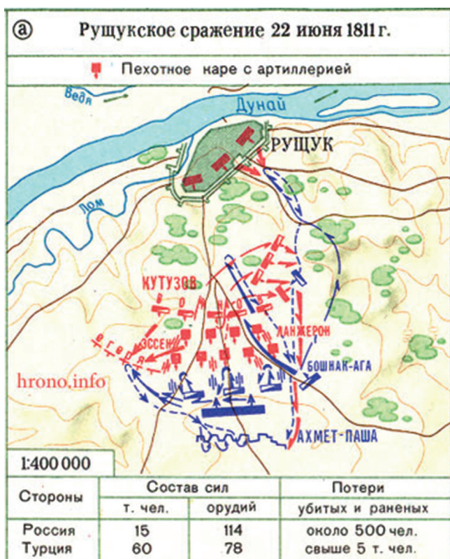
Схема расположения войск в сражении под Русчуком 22.06.1811 г.