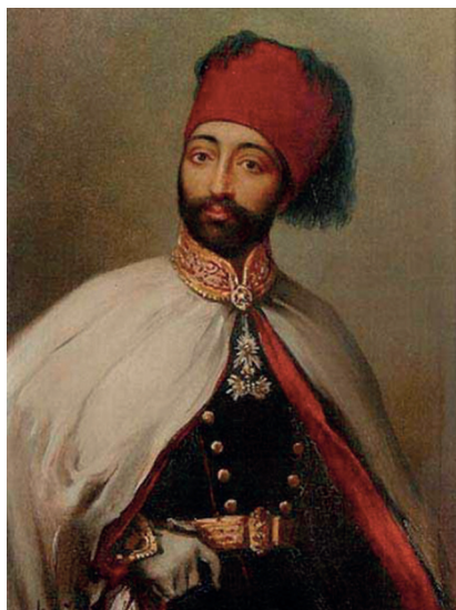
Султан Махмуд II (1785–1839)

Прибывающие гости подходили к Махмуду II с глубоким поклоном. Выражали благодарность за его мудрое правление, поздравляли с крупным военным успехом, желали султану здоровья и новых государственных успехов. Так же с поклоном отходили. Угощались, любовались изящными танцовщицами. У всех было приподнятое праздничное настроение. Музиканты старались вовсю. Меняя друг друга, показывали своё мастерство, стараясь привлечь к своей игре внимание гостей. Их мелодичные протяжные звуки, извлекаемые виртуозной игрой, завораживали, услаждали изнеженных именитых гостей.