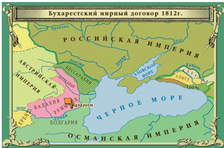
Новая карта России после Бухарестского договора 1812 года с присоединёнными землями