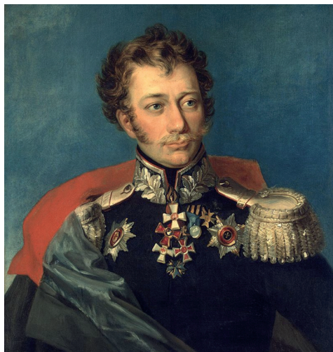
Полковник Иловайский Василий Дмитриевич, потомственный казак (1788—1860). Мастерская Джоржа Доу, Государственный Эрмитаж, Военная галерея, Санкт-Петербург