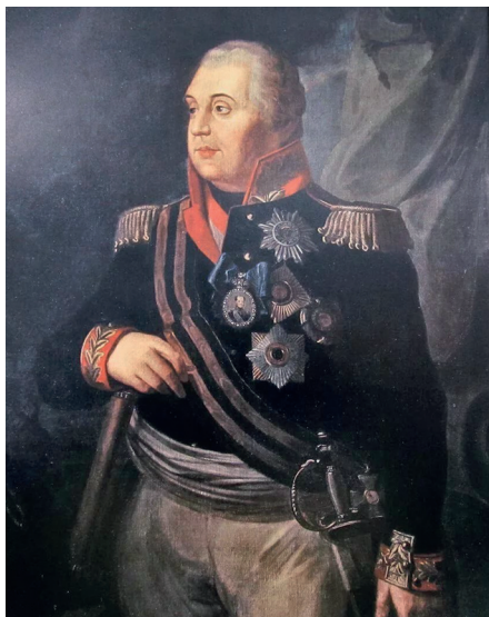
Михаил Илларионович Голенищев-Кутузов (1745–1813)

Зато молодые казаки эмоций не сдерживали — восторженно забалагурили. Один из казачков с напускным хладнокровием тоже взял хворостину, выкатил уголёк и попытался взять его пальцами. Его пальцы предательски стали подрагивать, но он, проявляя недюжинное мужество, поднял его. В пальцах уголёк зашкворчал. Громко ойкнув, он перебросил уголёк в ладонь, потом, словно горячую печёную картошку, перебросил в другую руку. Уголёк зашкворчал и в ней, но казачок уголёк не бросил, пытался перебороть боль.