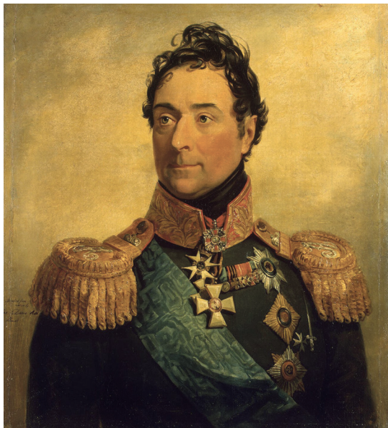
Генерал от инфантерии Ланжерон Александр Фёдорович (1763–1831). Мастерская Джорджа Доу, Государственный Эрмитаж, Военная галерея, Санкт-Петербург

Выслушав последнего докладчика, Кутузов не спеша встал, молча достал платок, промокнул выступившую слезу из больного глаза. В помещении стало несколько душно, но на предложение открыть окно командующий промолчал. Выйдя из-за стола, подошёл ближе к центру разложенной на столе карте. Взял из рук дежурного офицера резную указку из кости, ткнул её в место, отмеченное как город-крепость Шумла.