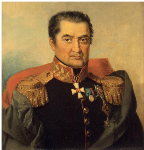
Генерал-лейтенант Евгений Иванович Марков (1769–1828). Мастерская Джорджа Доу, Государственный Эрмитаж, Военная галерея, Санкт-Петербург

Кутузов получил сведения от Каменского: хитрый Ахмет-паша за ночь переправил почти все свои силы на левый берег, сам же не собирается переносить свой штаб. Несмотря на все ухищрения Кутузова, оставил при себе некоторую часть войска.